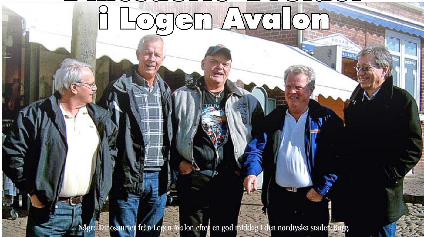
Några Dinosaurier från Logen Avalon efter en god middag i den nordtyska staden Burg.

För en broder i Logen Avalon tar inte tillvaron slut för att förvärvsarbetet råkar göra det. Egentligen är det då det verkliga livet börjar; nämligen som Dinosaurie-Druid.