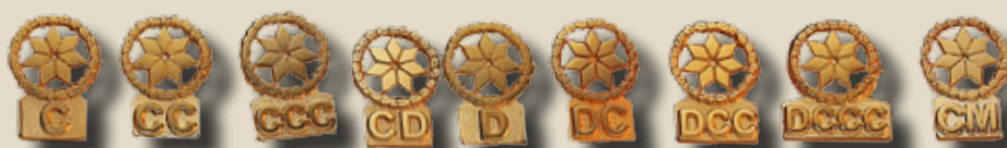
Trohetstecken för 100 - 900 möten