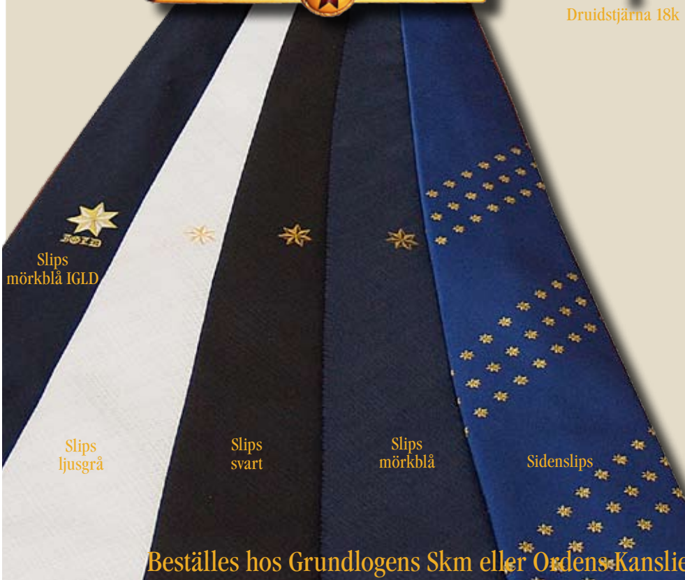
Slips mörkblå IGLD