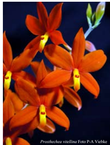
Prosthechea vitellina