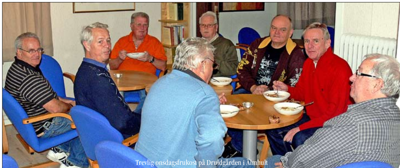
Trevlig onsdagsfrukost på Druidgården i Älmhult