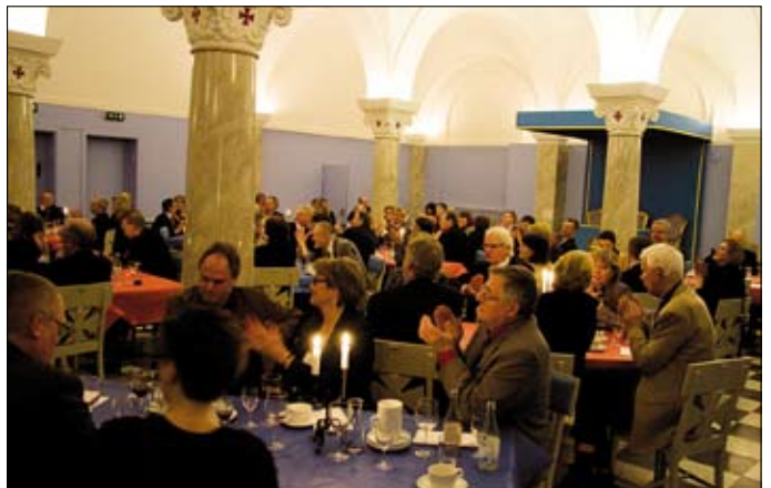
Logebröder och damer i den vackra Johannissalen

En våt, ruggig kväll samlades vi med damer i vår varma och välkomnande logelokal. Många nya ansikten syntes bland damerna. Det är ett resultat av tillströmningen av nya bröder i vår loge.