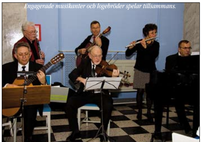
Engagerade musikanter och logebröder spelar tillsammans.

Vi kaffet underhöll en grupp som kallar sig "Lilla Trion". De spelade gamla kända filmmelodier. Så kända att många av oss sjöng med i refrängerna.